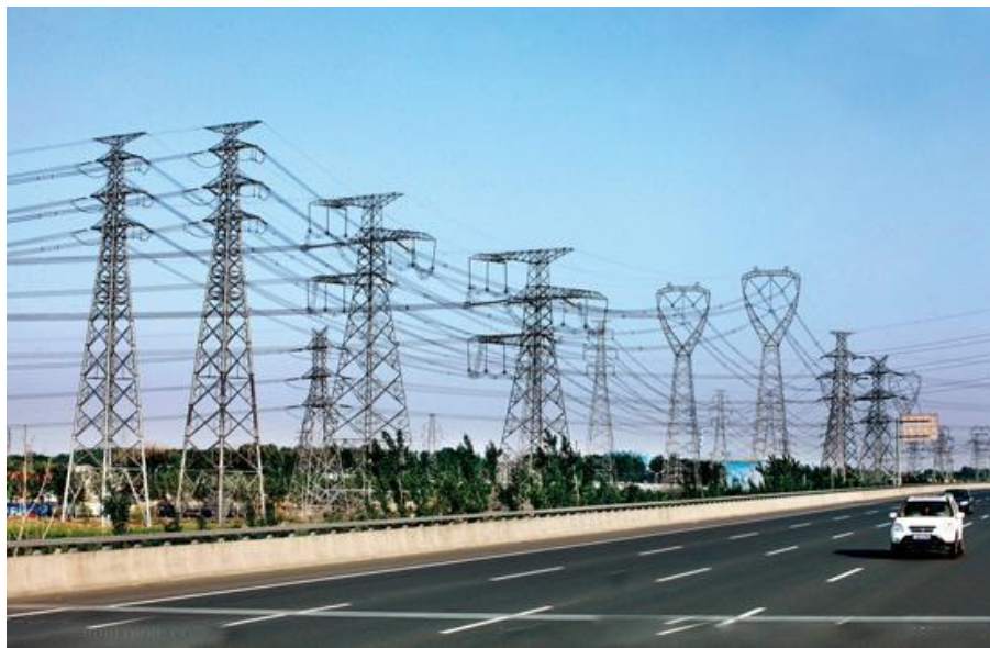
智能电网助推可再生能源大规模消纳

“加快发展智能电网是实现我国工业转型升级，实现节能减排的客观需求。近年来全球大规模可再生能源装机容量不断增长，而我国增速最快，这些可再生能源都要依靠智能电网来消纳，目前迫切需要加快智能电网发展。”近日，在中国电机工程学会年会的智能电网技术与装备论坛上，工业和信息化部党组成员、办公厅主任莫玮如是说。数据显示，截至2016年6月底，中国风电并网容量达到1.37亿千瓦，太阳能发电并网容量达到6304万千瓦。中国电机工程学会副理事长兼秘书长谢明亮表示，预计到2020年中国风电并网容量将达到2.1亿千瓦，太阳能发电并网容量将达到1.1亿千瓦。