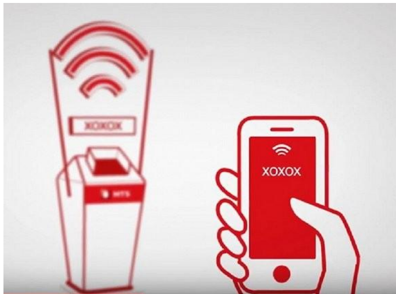
有 WiFi 的垃圾桶

最近，新加坡最著名的商业街乌节路（Orchard Road），就上岗了一批智能垃圾桶——靠太阳能驱动，能将垃圾进行压缩处理。装满以后，可以自动清洁人员发送信息。更神奇的是，这批垃圾桶还装有 WiFi，可以辐射周围 30 米的距离。人们享受 WIFI 的同时，也会收到附件商家的广告。