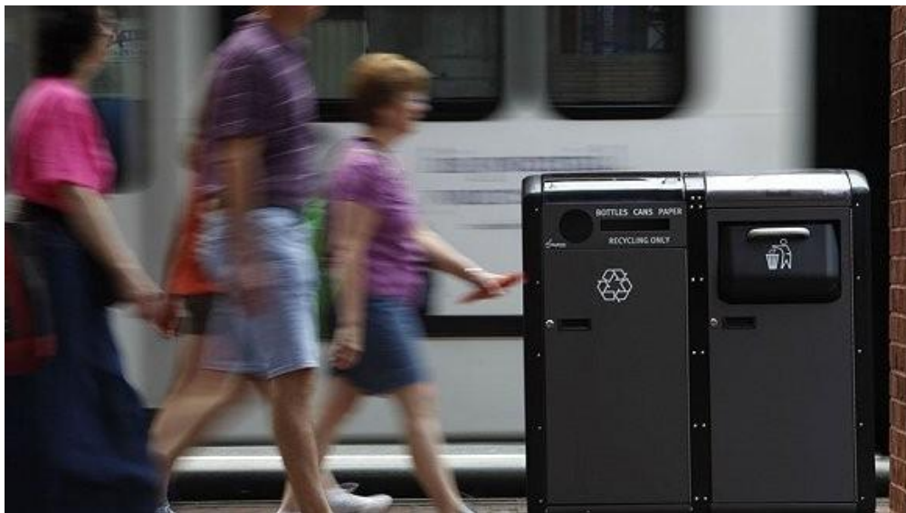
城市街头的智能垃圾桶