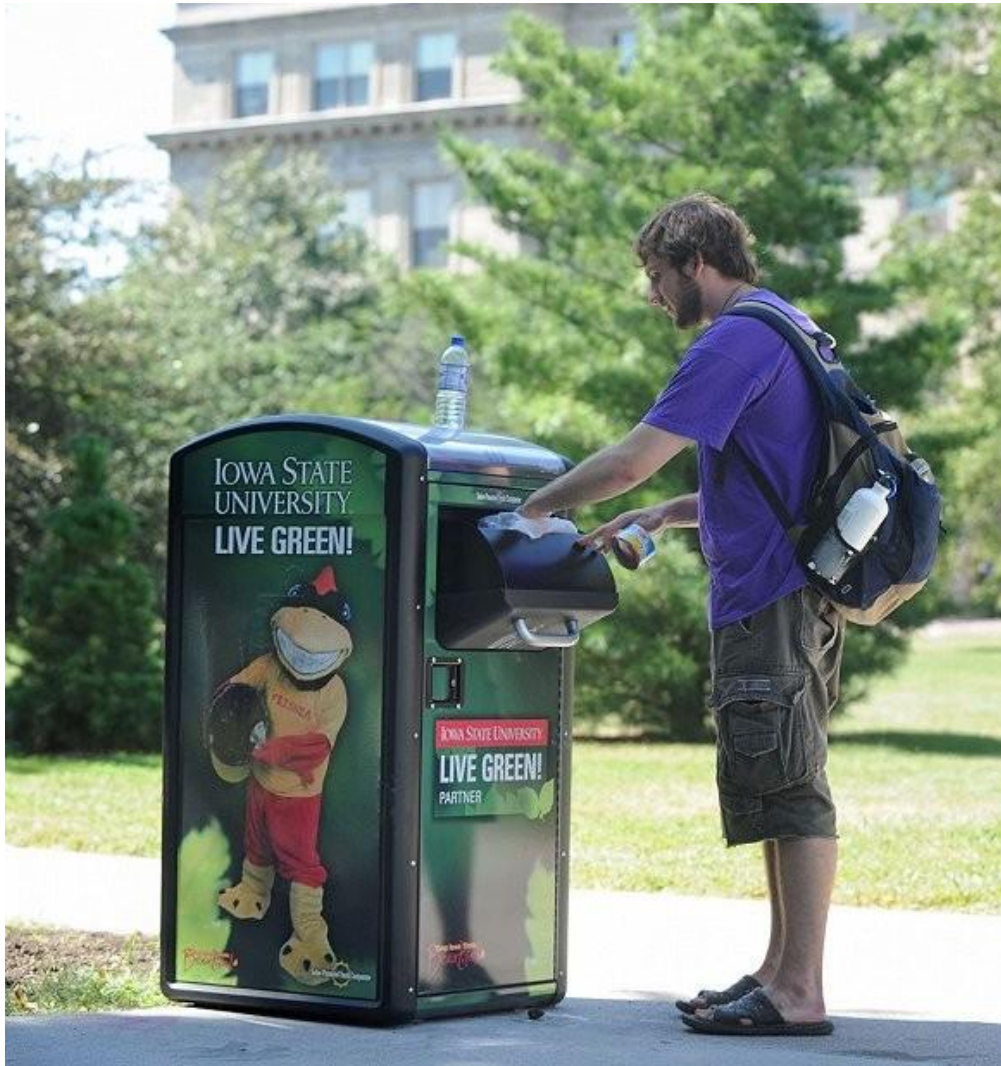
美国爱荷华州的智能垃圾桶