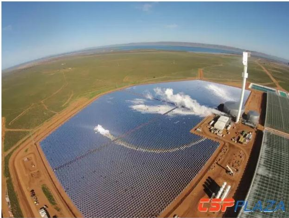
图：光热综合利用系统

在沙漠地区种植蔬菜——这对于解决世界不断加剧的食品安全问题来说，像是一个天方夜谭。然而，随着革命性的专为沙漠农场打造的光热电厂的正式运营，这个梦想已经变成了现实。10月6日，干燥地区可持续农业的先锋者 Sundrop Farms 在 Port Augusta 正式启动了其 20 万平方米的具有世界顶尖技术的温室农场。与传统的农作物生产相比，Sundrop Farms 的温室并不依赖化石能源和珍贵的淡水资源，而是可利用太阳光产生的光热和海水淡化水每年生产 1700 万公斤西红柿。事实上，依照传统观念这一地区从来都不适应任何农作物的生产。