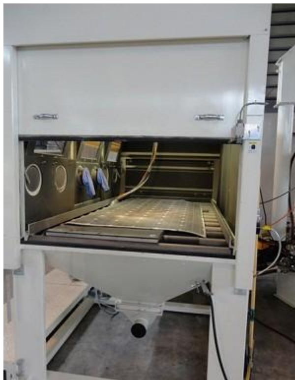
在直压式喷射装置内高效分离玻璃成分